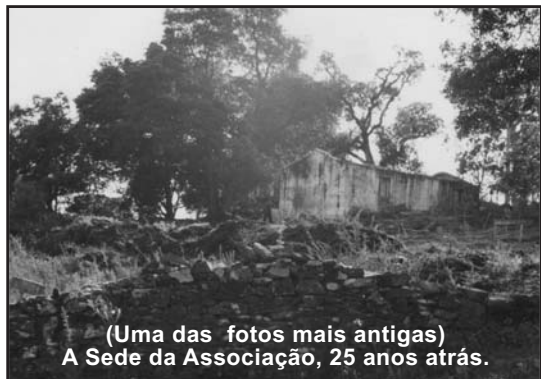
(Uma das fotos mais antigas) A Sede da Associação, 25 anos atrás.

Fotografias da sede, de máquinas fotográficas, de loiça antiga, peças de artesanato e muitos outros objectos estiveram expostas na actual sede da Associação Desportiva, Cultural e Social de Subportela. Numa só exposição inaugurada no dia 6 de Agosto, a direcção da associação conseguiu juntar imagens de diversas épocas, o retrato vivo de muitos momentos passados por quem decidiu dar um pouco do seu tempo em prol desta causa.