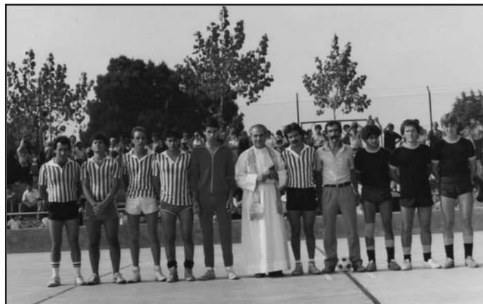
(Uma das fotos mais antigas) Inauguração e Benção do Campo de Jogos

A organização nunca pensou conseguir juntar tantas fotografias, de onde se destacaram algumas onde surge a sede da associação. Uma casa por onde já passaram muitas direcções, onde já se decidiram e planejaram muitas actividades e que mudou ao longo dos últimos anos. Com a exposição foi possível viajar no tempo e recordar o passado. Imagens que se prolongarão no tempo e que